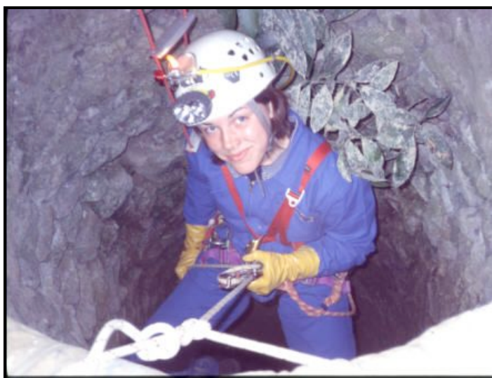
Descente du puits de 13 m