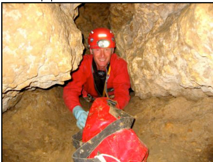
Galerie située à la base du puits d'entrée

MARDI 16 OCTOBRE 2007 CARRIÈRE DE L'ÉCORCHEVEAU Saint-Avertin-37-✱