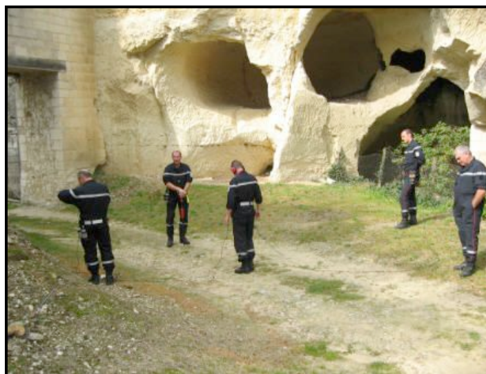
Recherche avec un vibraphone