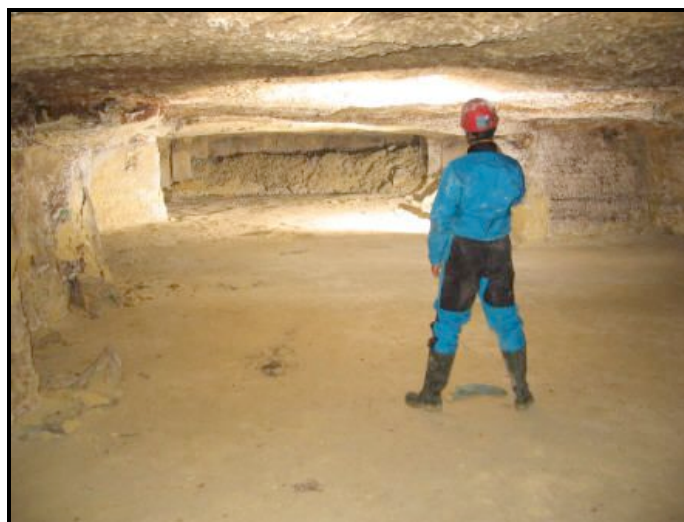
Carrière du Chemin des Grottes-30-08-07