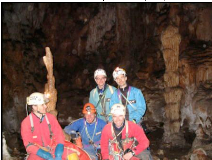
Fond de l'igue de Clouzman

L'archipel se divise en deux séries d'îles : les îles sous le vent au sud (Brava, Fogo, Santiago et Maio) et les îles au vent (Boa Vista, Sal, São Nicolau, Santa Luzia, São Vicente et Santo Antão).