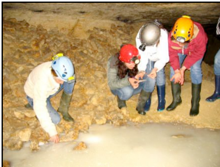
La calcite flottante-11 mai 2007

MERCREDI 17 OCTOBRE 2007 CÉRÉMONIE DE REMISE DES MÉDAILLES MINISTÉRIELLES JEUNESSE ET SPORTS A 17H30 dans les salons de la Préfecture d'Indre et Loire