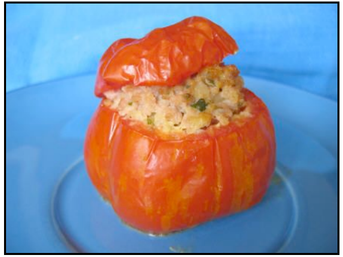
La tomate <<Cavern>> du jardin...