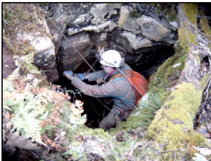
Départ de puits

MARDI 9 OCTOBRE RÉUNION MENSUELLE DU COMITÉ DE DIRECTION ET DES RESPONSABLES DE COMMISSIONS, à 20h30, au siège de l'association