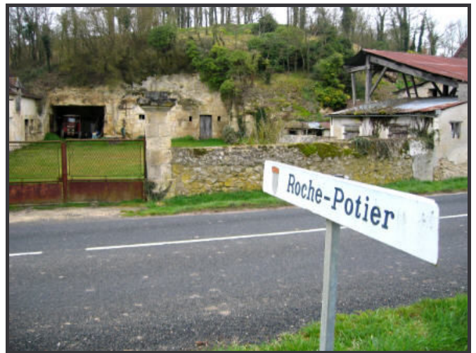
Ferme de Roche Potier-37- Photo F.Gay

Contactez Françoise CHENOFFE au 02 47 59 69 09