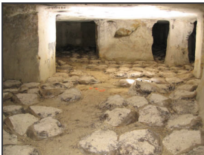
Carrière des Vignes du Temple-37-