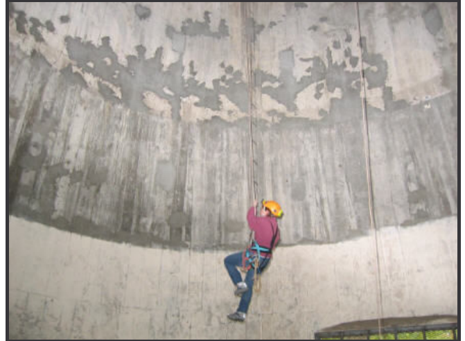
Paroi à peindre