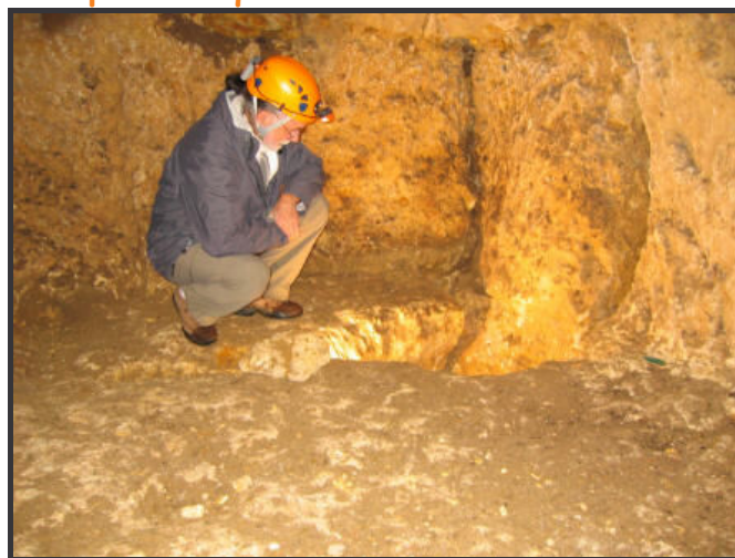
Salle terminale de Roche Potier-37- Photo F.Gay

Contactez Françoise CHENOFFÉ au 02 47 59 69 09