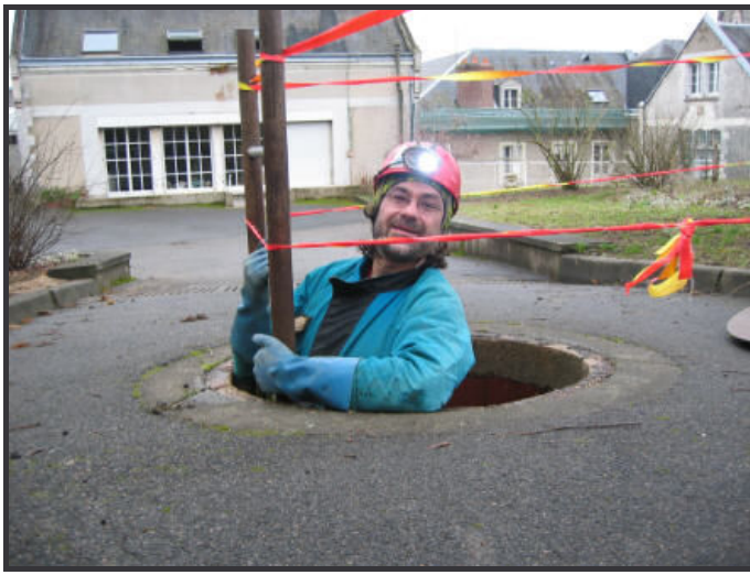
Descente par le puits- Grande Bretèche-37