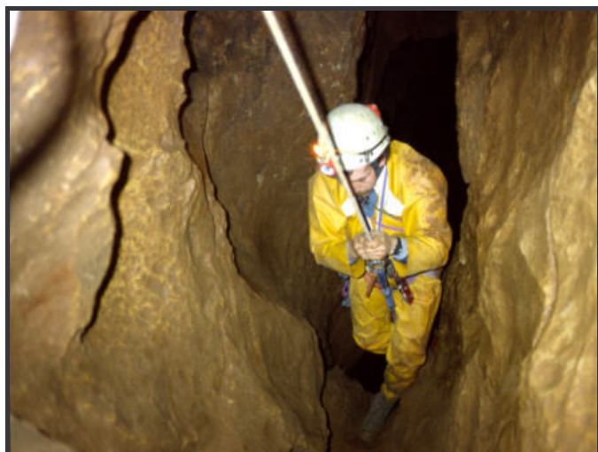
Igue de Planagrèze-46- Photo F.Gay