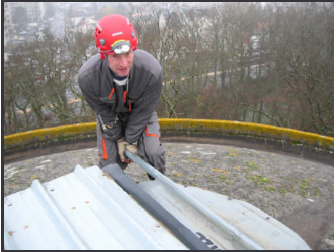
Renforcement des tôles en sortie de puits

Rendez-vous à 9 h sur place avec de vieux vêtements de travail et des rouleaux à peinture.