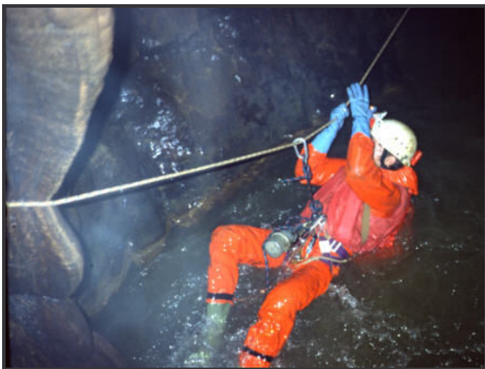
Rivière de la Pucelle-46-