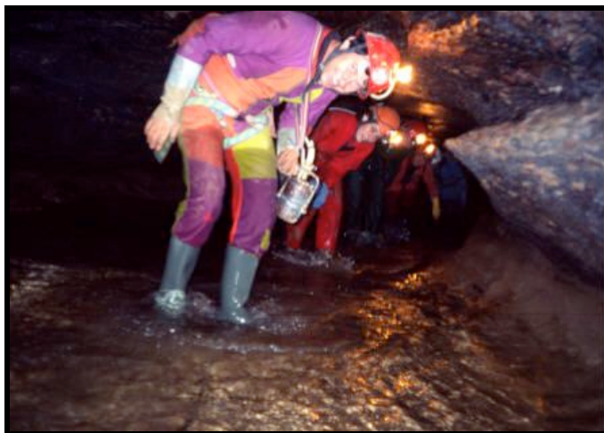
Rivière de St.Christophe sur Roc