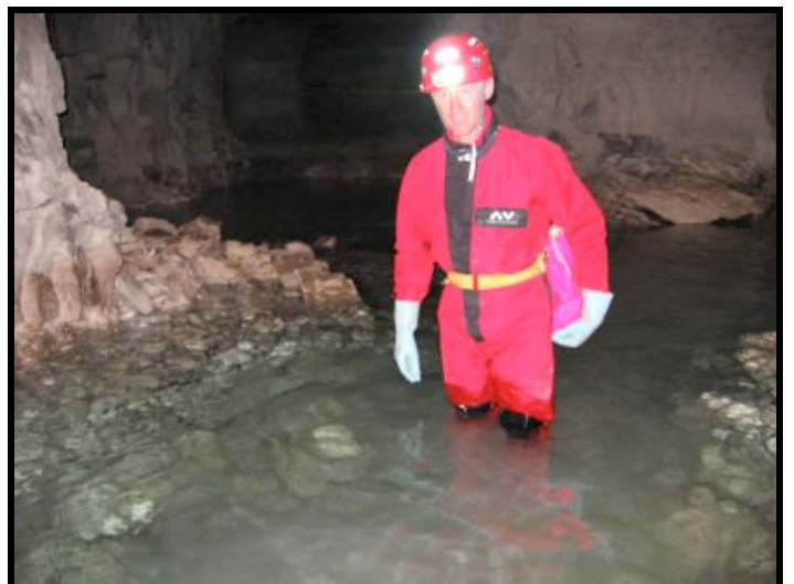
Carrières de la Gare de Trogues-12-06-07- Photo F.GAY

Si cette sortie vous intéresse. Signalez le, à François GAY. Une date sera fixée en commun.