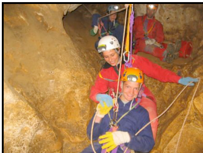
Grotte Chabot le 2 juin 2007