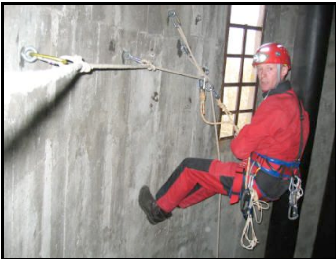
Guy au Château d'eau de Grandmont-37- Photo F.GAY

Durant l'été, en semaine, du lundi au vendredi, en fonction de la demande ( contacter F. GAY )