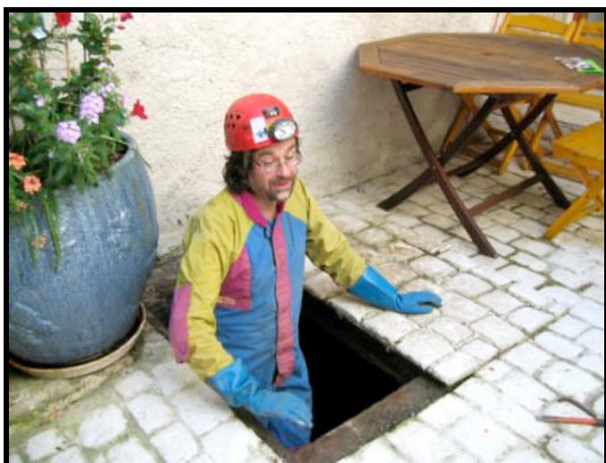
Descente dans les caves le 9-05-07