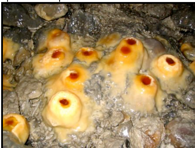
Carrières de Chinon