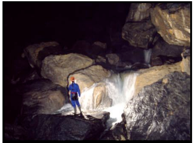
Salle de la Verna

Renseignements : Jean-Luc FRONT ☎ : 02 38 49 18 10 @ : gas@mageos.com