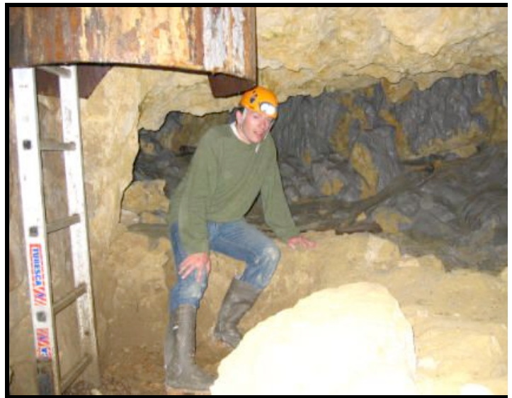
Base du puits d'accès-18-06-07

Si cette sortie vous intéresse. Signalez le, à François GAY. Une date sera fixée en commun.