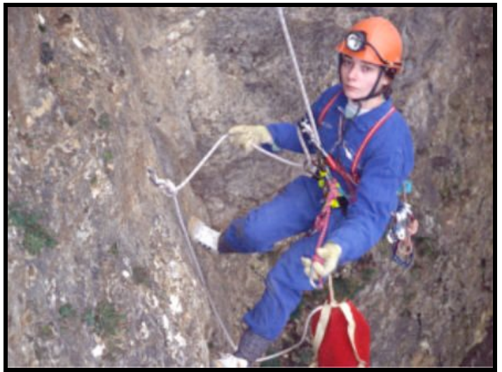
Falaises de Béruges-86

Si cette sortie vous intéresse. Signalez le, à François GAY. Une date sera fixée en commun.