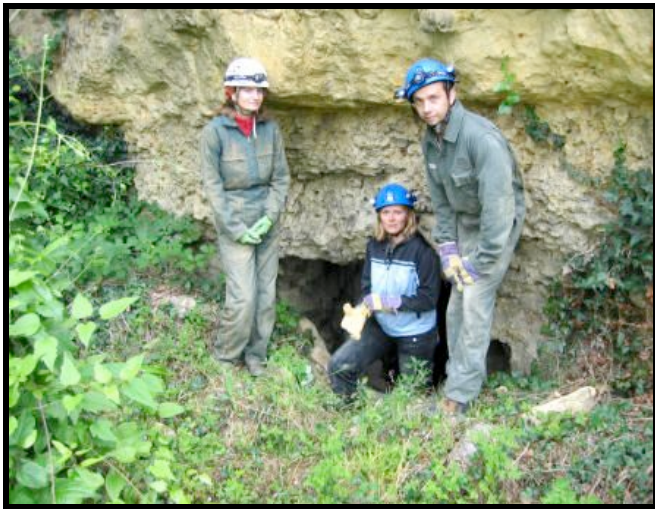
Caves en front de côteau-13-06-07

Si cette sortie vous intéresse. Signalez le, à François GAY. Une date sera fixée en commun.