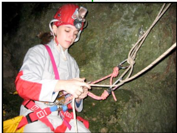
Départ de la descente du 2ème puits

Spéléologie – Canyon – Spéléo-Secours – Archéologie souterraine - Le Spéléo-Club de Touraine fut fondé le 10 mai 1948